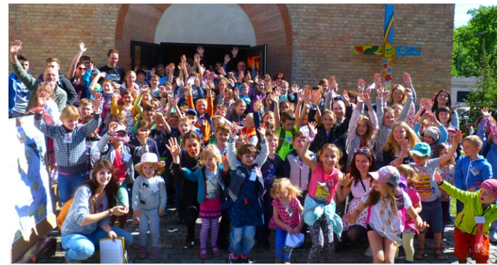
Teilnehmer beim Kinder-Kirchen-Tag bei strahlendem Wetter.

Unterstützen Sie den Druck des Kirchenjournals.